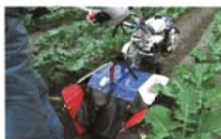
フロッキー土寄せ作業風景

ワンタッチでハンドルがロータリ側、エンジン側に回転。1台で中耕・培土・溝掘・土寄せまで、幅広い作業に対応します。(KNR3VC除く)