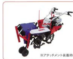
※アタッチメント装着時