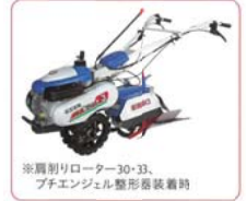
※肩削りロータリー30-33、ブチエンジェル型装着時